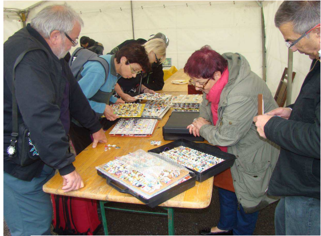
Des collectionneurs plus nombreux chaque année

Passionnés et visiteurs sont venus nombreux de Bourgogne, de Rhône-Alpes, de Franche-Comté, de l'ouest, de Suisse... découvrir les précieuses miniatures ou dénicher la perle rare. Accueillis à la salle des fêtes et sous deux chapiteaux par une quinzaine d'exposants, certains fabophiles ont pu compléter leurs collections ou acheter de nouvelles séries, d'autres ont procédé à des échanges.